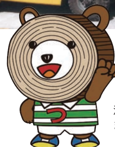
津別町 まる太くん

季節労働者の方で、資格取得・技能講習等の申込をされる方は、「季節労働者向け通年雇用促進支援セミナー」に必ず参加していただきます。 技能講習や資格取得をされる方は、必ず事前に申込が必要です！取得後の申込は認められません。